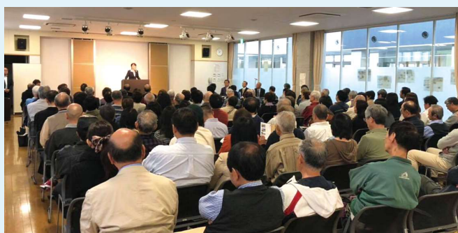
▲ 開催に際して応援団のみなさんにご協力いただきました。とても心強く、うれしく、感激でした！ありがとうございます！

一般質問では、このほかに、東日本大震災からの真の復興に向けた重要な事業である「地籍調査」について、現状と計画を確認しました。