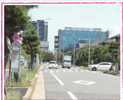
▲ 通勤・通学時間帯には、自転車や歩行者も多く危険な状況がみられる。

第二湾岸道路との抜け道として交通量が増えている交差点。信号設置の要望をいただいています。調査の結果、信号設置基準を遙かに超える1時間に471台の交通量があります。今後の開発計画で更に車両が増えることはあきらめず、信号設置者である県へ、粘り強く要望するよう求めました。