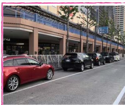
▲ たくさんの送迎車両が停車している新浦安駅南口

路肩に停車した車両で、バスの運行にも支障が出ている状況です。バス専用レーンの設置など改善策を質問したところ、「バス専用レーンは有効であるものの課題も多いため、駅前広場入口部分の改修から取り組んでいきたい」と(都市整備部)とのことです。