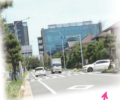
日の出保育園入口バス停前交差点 信号要望 (詳細：裏面一般質問へ)

下の写真で私が右手に持っているのは、「ヘルプマーク」。市民相談を受け、浦安市での作成と配布、更には普及・理解の促進に向けた市の取り組みを議会で要望。8月からストラップタイプの配布がはじまることになりました。こんな風に市民の皆さんの声を、担当課にそして議会に届けています。小さな気づき、お気軽にお知らせください。