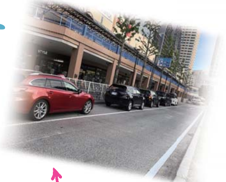
新浦安駅ロータリー混雑 (詳細：裏面一般質問へ)